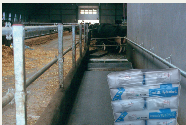
Håndteret uden de rette forholdsregler kan hydratkalk til fodbad forårsage skade på synet.

DET VAR VED AT VÆRE FYRAFTEN , og en medarbejder manglede blot at fylde hydratkalk i fodbadet til kvierne. Han havde travlt, så han smed sækken fra skulderhøjde – sækken revnede, og der stod en sky af hydratkalk op i ansigtet på medarbejderen, der hverken bar briller eller støvmaske. En kollega hjalp ham straks med at påbegynde øjenskylning. Der blev rekvireret en ambulance, og medarbejderen blev kørt på skadestuen. Sikkerhedsdatablad på hydratkalk blev medbragt, så man på sygehuset straks var klar over, hvad der havde forårsaget skaden. Øjnene blev skyllet i ambulancen, og skylningen fortsatte i to timer på skadestuen. Efter fire dages gener i øjnene er medarbejderen uden mén.